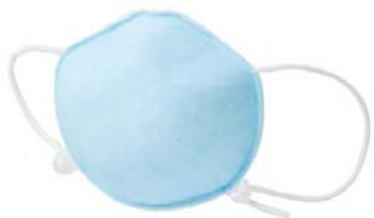
「ハイラック Neo KIDS」 スタンダードタイプ