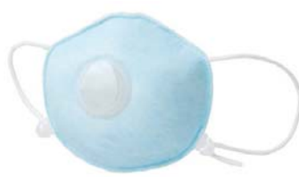
「ハイラック Neo かからんぞ KIDS」 長時間使用にも呼吸がラクな 排気弁付き