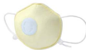
「ハイラック Neo うつさんぞ KIDS」 呼吸がラクな吸気弁付き (感染症患者専用)