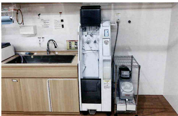
シンクと並んでスッキリ設置されている『鏡内侍ⅡG』

また、新しくなった『鏡内侍ⅡG』は私が知っていた前モデルよりもスリムになっていたことや、内視鏡のセット方法も改善されていて楽にセットができるため、より一層導入に気持ちが傾きました。