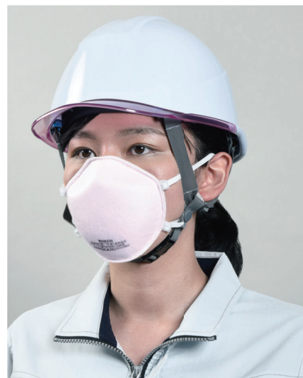
サカキ式 ハイラック 330 型 (爽やかさをイメージさせるラベンダー色を採用)

当社は健康障害防止の役割を担う保護具防じんマスクのメーカーとして、女性の作業の方々にも「安全」に「安心」して「快適」にマスクを使用して各作業現場で大いに活躍していただくことを目的に、多くの粉じん職場で使用されている当社製使い捨て式防じんマスク「ハイラック」シリーズをベースとして、厚生労働省の国家検定合格品であり、かつ女性が着用、使用しやすい新製品「サカキ式ハイラック 330 型 / 335 型」を開発いたしました。