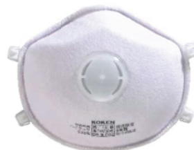
サカキ式 ハイラック 335 型 (排気弁付き)