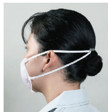
髪形に応じて「フック」の位置を変えることができます