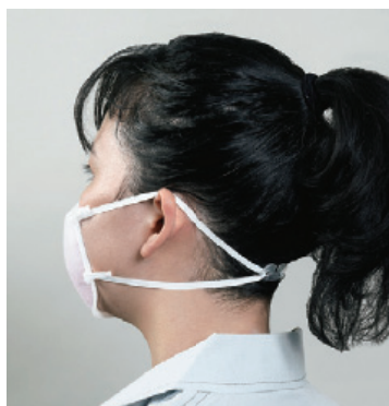
耳にかかる「上ひも」だけの張り具合を調整できます