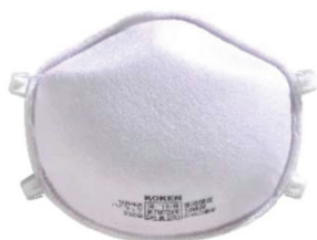
サカキ式 ハイラック 330 型 (標準型)

作業環境中の粉状物質の測定濃度が目標濃度を超える場合には、厚生労働省「国家検定に合格した防じんマスク」等の着用が必要とされています。本製品ハイラック 330 型 / 335 型は、ともに国家検定に合格しており、安心して作業ができます。